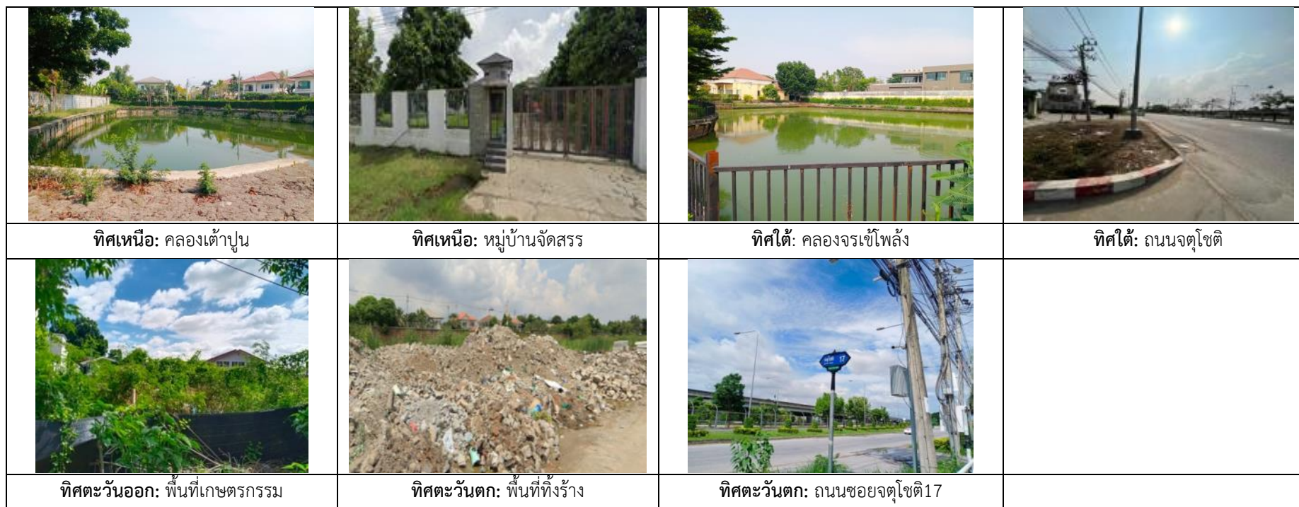
รูปที่ 1.2 แสดงการใช้ประโยชน์บริเวณพื้นที่โครงการและพื้นที่ใกล้เคียง