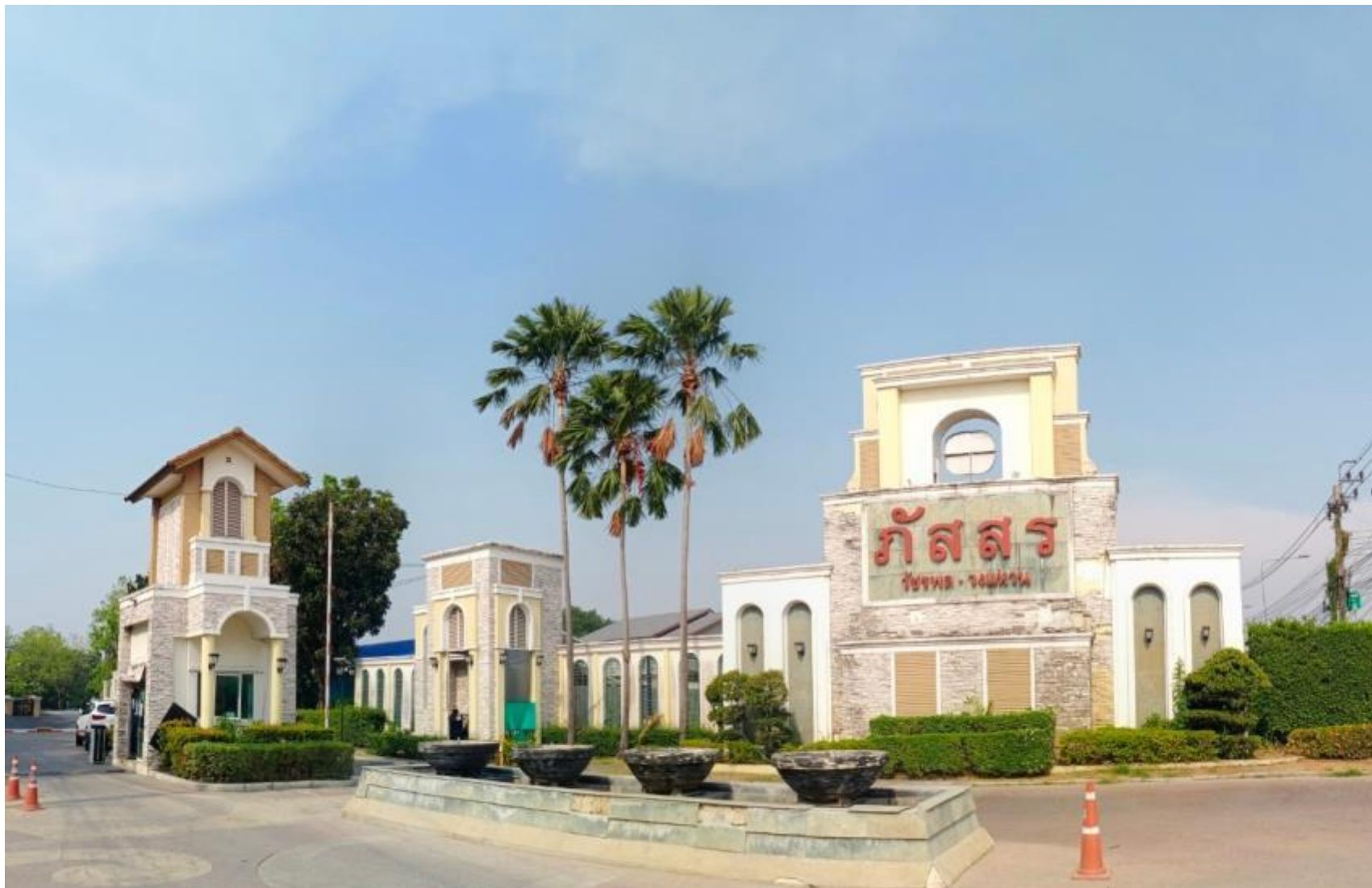
รูปที่ 1.3 สภาพโครงการในปัจจุบัน